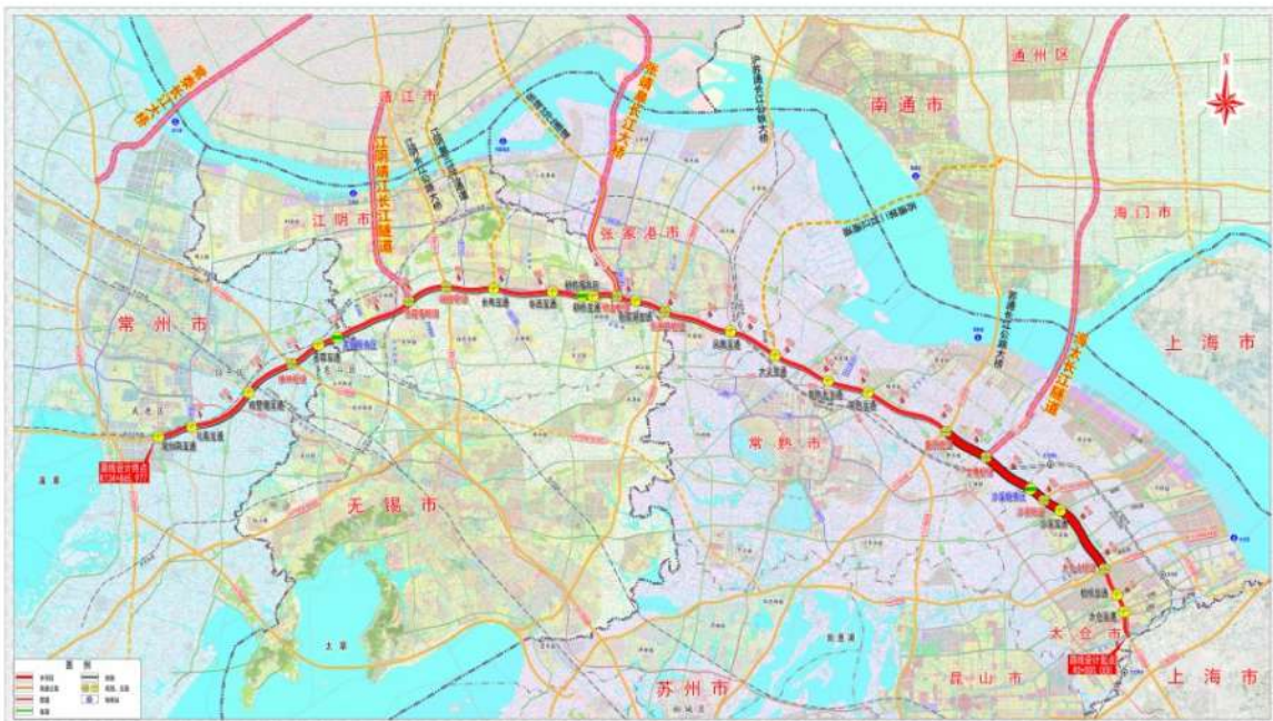
沪武高速扩建工程

此次我们主动奔赴沪武高速某一段施工项目现场——作为连接长三角与中部地区的交通动脉，该路段拓宽工程正处于关键推进阶段，而酒井的压路机(SW888ND-1及SW888S-2机型)已在此连续高强度作业多日。为确保设备始终保持最佳工况，助力客户高效推进施工进度，公司主动安排此次上门“体检+ 维护”服务，以主动服务前置保障，践行“配合客户完美售后”的承诺。